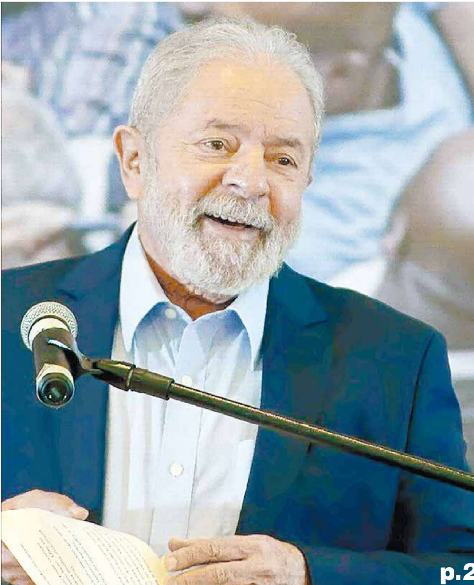
El expresidente Inácio Lula da Silva avanza en las preferencias de su pueblo para la contienda electoral por la primera magistratura, avalado por el respaldo de los resultados de su anterior mandato y el prestigio alcanzado en decenas de años de lucha política.